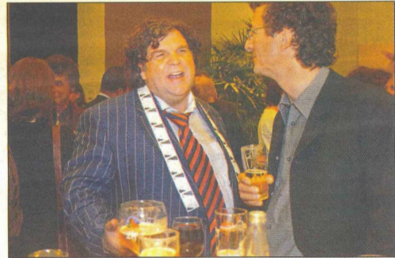
F.Th. van der Heijden, literair zwaargewicht, met een sjerp van drankbonnen.