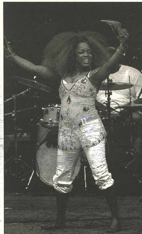
Leela James: „Ik speel geen rolletje. Ik ben een product van de kerk”.

Religieus wil Leela James zichzelf niet noemen. „Maar als ik zing, graaf ik diep in mezelf, en ga ik op zoek naar mijn oude ziel”, zegt ze. „Het is iets heel spiritueels. Ik speel geen rolletje. Ik ben een product van de kerk. Mijn hele jeugd spendeerde ik in gospelkerken en die invloed gaat er niet zo snel uit. Ik probeer met mijn publiek die gospelervaring te delen.”