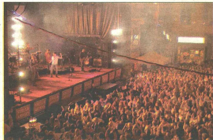
Voor het podium was het dringen, achteraan was ruimte zat.

Een nieuwe markt voor Clouseau, wie weet? Veel fans reden donderdag meteen na het concert naar huis, sommige wilden nadien ook wel iets van de Gentse Feesten meepikken. Of die beter zijn geworden van de stunt, blijft de vraag. Pleinen afsluiten breekt toch de sfeer, die het moet hebben van toevallige ontdekkingen en vrienden die elkaar tegen het lijf lopen. Een speciaal optreden gaf Clouseau ook al niet — dit was er maar eentje van de tournee die de groep aan het doen is. Daarvoor zijn de Feesten toch te speciaal.