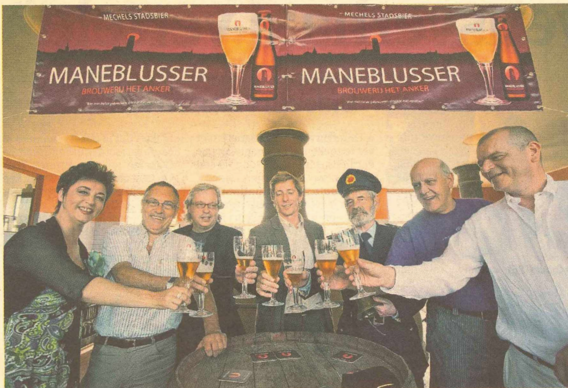
De proefkonijnen van dienst heffen het glas op de geboorte van het nieuwe stadsbier.