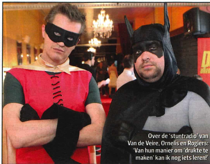
Over de 'stunradio' van Van de Veire, Ornelis en Rogiers: 'Van hun manier om 'drukte te maken' kan ik nog iets leren!'

Toch wel. Ik amuseerde me te pletter bij de jeugdbeweging, organiseerde bivaks en Vlaamse kermisessen. Toneeltjes ook, waarvoor ik vijf frank toegangsgeld vroeg. Ja, daar was ik niet te beschaamd voor. (grijnst) Maar de school, nee daar moest ik niet van weten. Scholen zijn net kazernes. Mensen, laat u en uw kinderen zich toch omringen door móóie dingen!