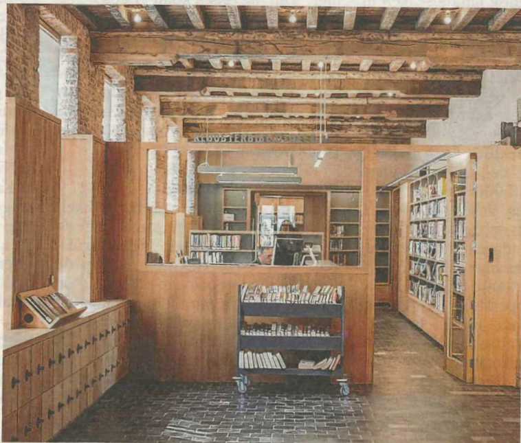
Het monument is met veel zorg ingericht als bibliotheek.