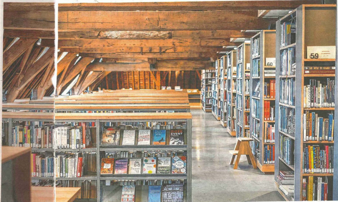
De indrukwekkende, eeuwenoude zolder van de bibliotheek is een van de mooiste plekjes van Het Predikheren

Samen met veel Mechelaars is de burgemeester de laatste om tegen te spreken dat het project tot herbestemming van het voormalige klooster geslaagd is. “Het is een overdonderend mooi gebouw, misschien wel het mooiste stadsproject van de voorbije twee decennia”, stelt Somers. Hij ziet zichzelf er al zitten eens hij met pensioen is. “Ik weet nu waar ik mijn oude dag zal slijten. Ik zie mij hier al zitten, over dertig jaar: rustig koffiedrinken op de binnenkoer met een krant, een boek lezen aan een raam in de zon, genietend van de rust, de aanwezig-